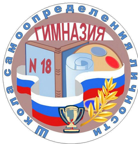
Рисунок. Эмблема МБОУ «Гимназия № 18»

Традиционные мероприятия: День знаний, День гимназии, День матери; Фестиваль проектов, «Встреча с известными выпускниками», День здоровья; конкурс «Минута славы», День открытых дверей для родителей будущих первоклассников.